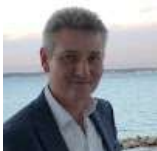
IT Specialist – Office365 – Backup - Sikkerhed

Kontakte os og få et tilbud på netop jeres løsning.